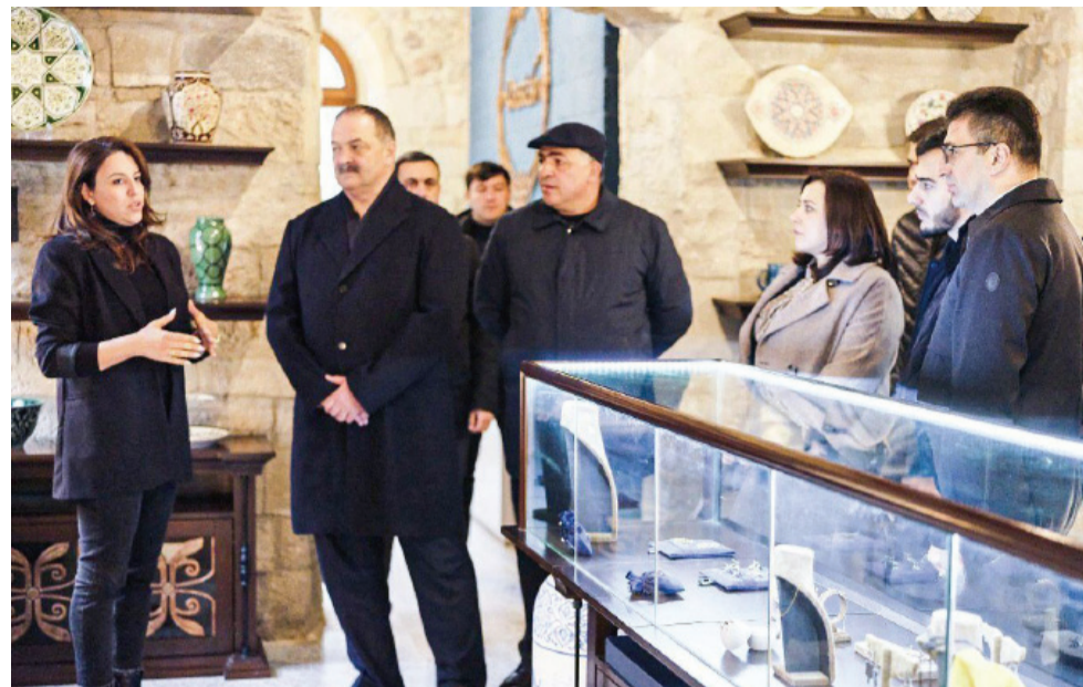
Безусловно, Ваш визит внесет лепту в развитие отношений между нашими странами»,

«Мы должны работать сообща, развивать все, что имеем, и закладывать основы новому.